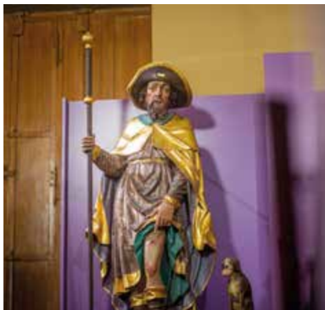
Sv. Roch z kostela sv. Šebastiána v Ingolstadtu