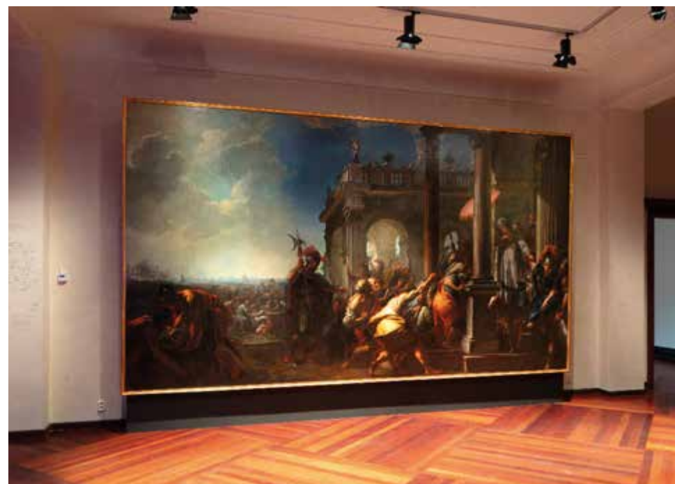
Petr Brandl: Historie Josefa Egyptského, 1721, zámek Jindřichův Hradec