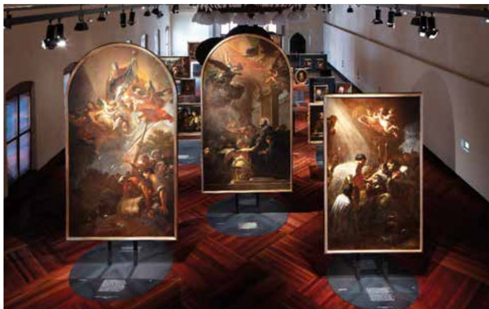
Petr Brandl: odleva Nalezení ostatků sv. Otmara, Smrt sv. Benedikta, Smrt poustevníka Vintíře, 1719, Klášter Břevnov

společenské a profesní konvence i jako umělce, pro něhož tvůrčí a osobní svoboda stála na prvním místě.