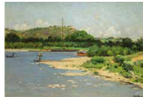
Antonín Chittussi: Partie z Troje u Prahy, 2. pol. 19. stol. NGP

metmi pražských parníkov, zo zbierok troch inštitúcií.