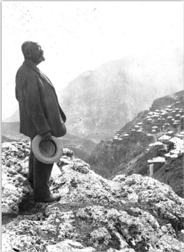
Ludvík Kuba znovu v Makedonii, Galičnik 1927