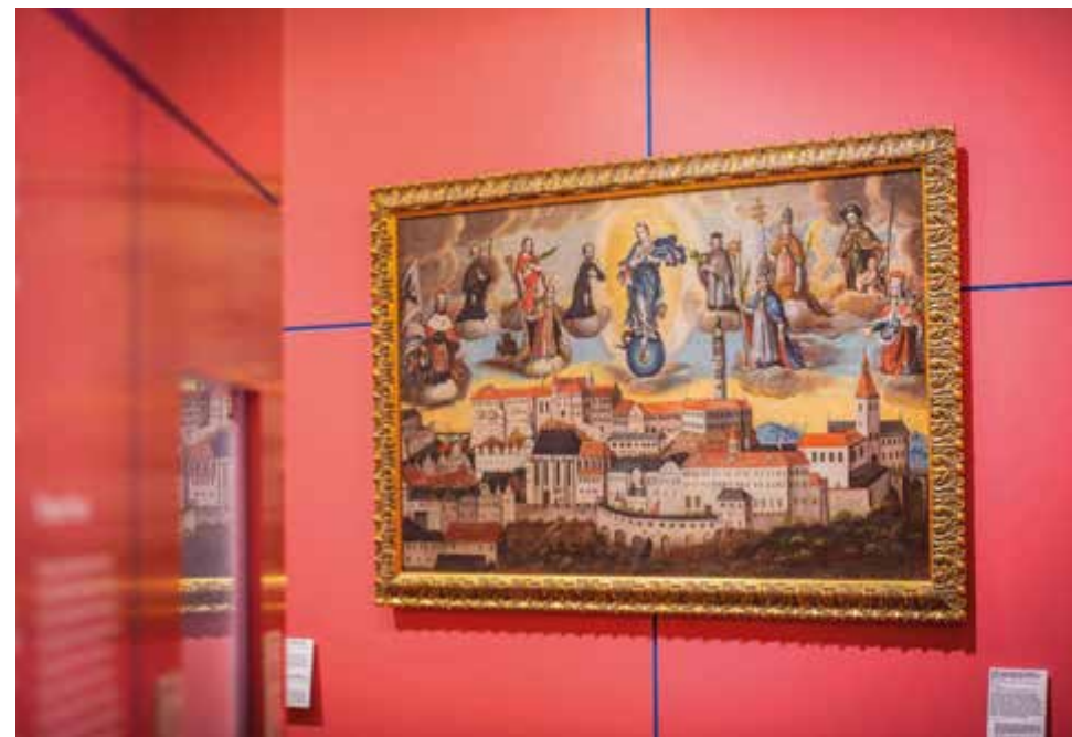
P. Anneis: Český Krumlov pod ochranou Immaculaty a světců