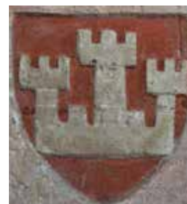
První znak Prahy, 1360