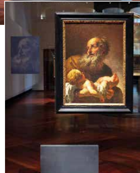
Petr Brandl: Simeon s Ježíškem, 1725

Poslední výstava Brandlových obrazů se konala před více jak 50 lety. K 300. výročí umělce-va narození představila NG v roce 1969 jeho dílo v Jízdárně Pražského hradu. Reprezentativní výběr tehdy tvořilo 68 autentických Brandlových obrazů, dále jeho dopisy, kresby a rytiny. Tento „český Rembrandt“ je za hranicemi málo znám, tato výstava to mohla změnit. Prezentovala totiž nové poznatky o Brandlově tvorbě, které jsou výsledkem dlouhodobé badatelské činnosti, a navázala tak na předchozí projekty Národní galerie Praha i kurátorky výstavy Andrey Steckerové. Celý koncept byl nově postaven na vyprávění dvou prolínajících se příběhů: příběhu výjimečné umělecké tvorby a neméně výjimečného života, k němuž máme dochováno nebyvalé množství archivních dokladů. Ty vykreslují Brandla jako člověka odmítajícího