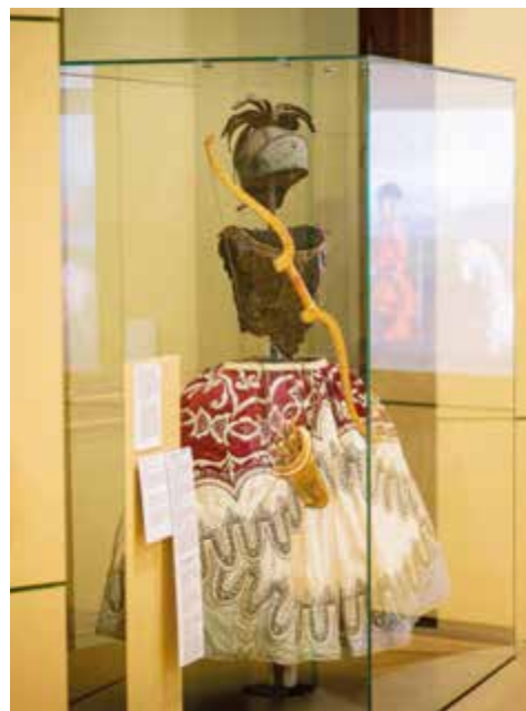
Kostým Pallas Athena z divadla Č. Krumlov