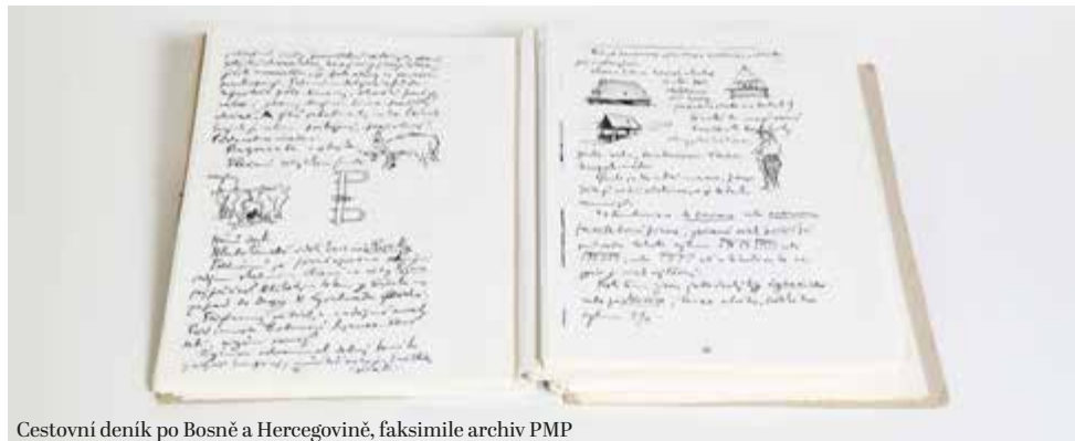
Cestovní deník po Bosně a Hercegovině, faksimile archiv PMP