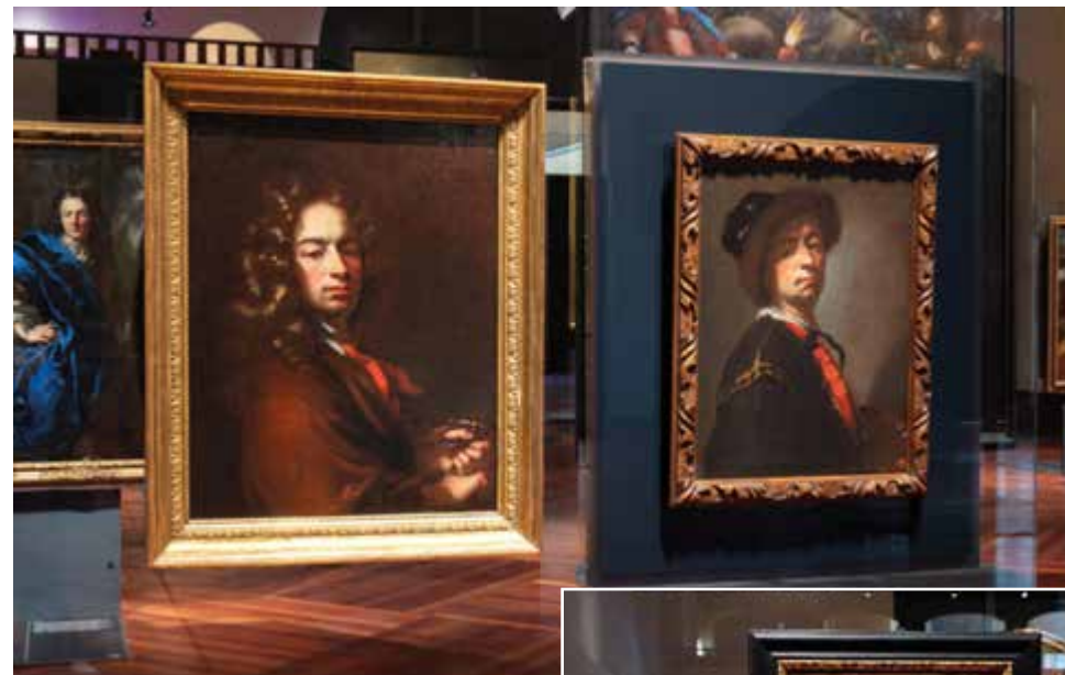
Petr Brandl: Podobizna (Strahovská) 1703

Národní galerie Praha připravila ve Valdštejnské jízdárně výstavu jednoho z nejvýznamnějších českých barokních umělců – Petra Brandla, geniálního malíře, ale také věčného dlužníka, nevěrného manžela, marnotratníka, velkého gurmána a ... vězně. Výstava čítající 64 převážně velkoformátových autorových maleb poprvé představila také díla nově objevená či dosud nevy-stavená, jako jsou Křest Kristův , Vize sv. Anny nebo Vlastní podobizna zvaná Videňská , ale především provedla návštěvníky bohatým životním příběhem Petra Brandla.