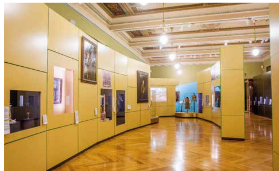
Barokní divadlo světa

rodním muzeu je přehlídkou vynikajících uměleckých děl, která představuje obě země, Čechy i Bavorsko, jako součást jednotného prostoru barokní kultury ve střední Evropě.