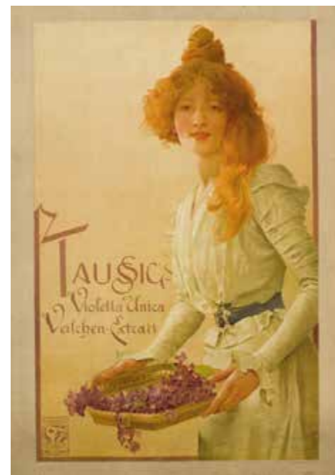
Vojtěch Hynais, Taussig's Violetta Unice Veilchen Extrakt, 1900, Uměleckoprůmyslové museum v Praze

Národní galerie v Praze, Národního muzea, Oblastní galerie Liberec, Památníku národního písemnictví, Sbírký plakátů Terryho ponožky, Sklářského muzea Nový Bor, Uměleckoprůmyslového muzea v Praze a soukromých sběratelů.