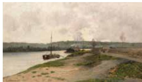
Antonín Chittussi: Krajina se Seinou, 1885. NGP

Na výstave ako kuriozitu prvýkrát predviedli tri rozmerné plátna Jakuba Schikanedera s ná-