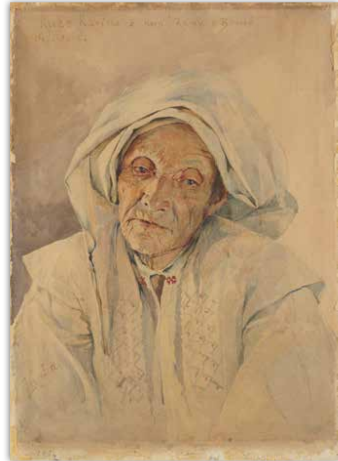
Ludvík Kuba: Horní Ramy v Bosně

Evidováno u Ministerstva kultury ČR pod číslem: E 11045 Tisk: INDIGOPRINT, s. r. o. Distribuce: Adiservis, s.r.o.