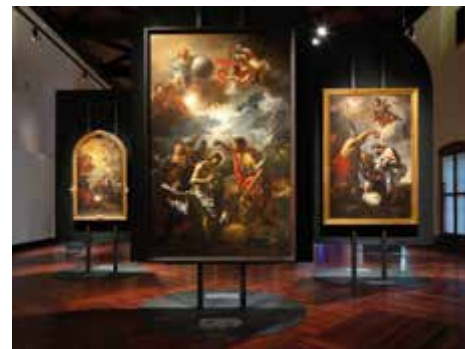
Petr Brandl: Kristův křest, 1716, Manětín