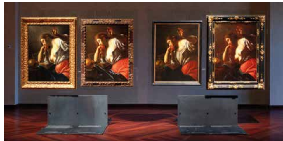
Petr Brandl: Kající se Maří Magdalena, po roce 1719, originál a 3 kopie