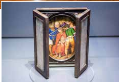
Cestovní oltář vévodů Viléma V. Bavorského

Navzdory velké evropské krizi známé jako třicetiletá válka, navzdory období válek i morovým ranám rozkvétá v Evropě v době mezi 20. léty 17. a 20. léty 18. století epocha předurčující povahu české i bavorské krajiny, která si tento ráz nese dodnes. Obrovský rozvoj nastává ve všech kulturních i společenských oblastech a baroko se stává dynamickým životním stylem, jehož podstatou je neustálý pohyb, rozvoj architektury, malířství, sochařství, hudby, divadla či vědy, ale i víry. Příběh baroka v Ná-