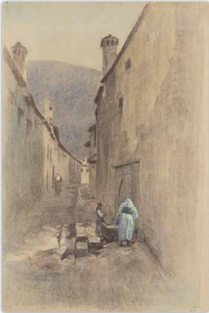
Ludvík Kuba: Ulice v Mostaru