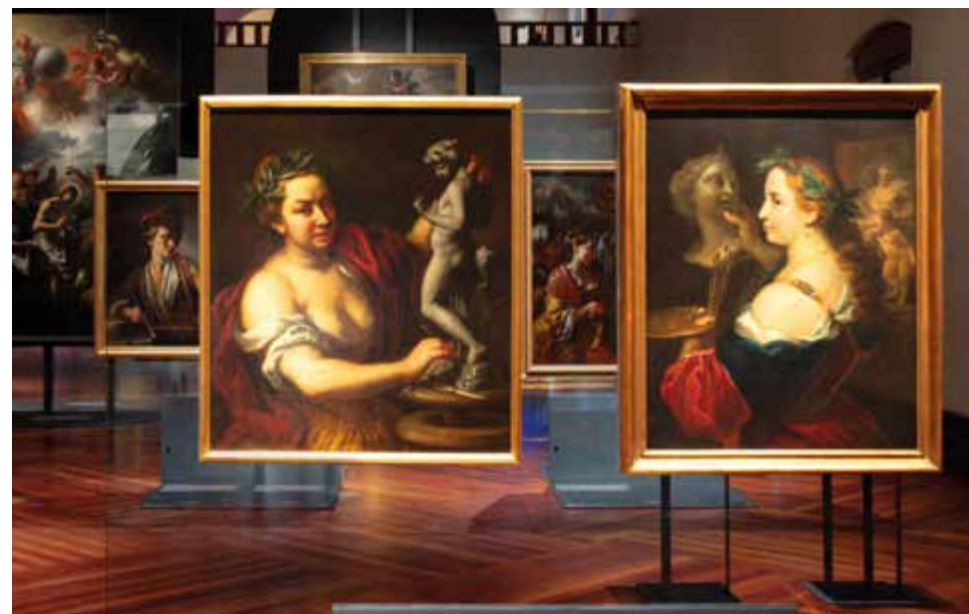
Petr Brandl: Alegorie sochařství, 1710, J. Kupecký Alegorie malířství

Na výstavě byl ke zhlédnutí široký rozsah Brandlovy tvorby. Zdůrazněn byl fenomén Brandlovy malířské techniky a jeho osobitý, nezaměnitelný rukopis, který z malíře učinil nejvíce žádaného a nejlépe placeného umělce své doby. Výstava byla strukturována podle chronologické linie, která byla v určitém místě přerušena ucelenou skupinou děl daného tématu, separátně bylo např. poukázáno na Brandlovu portrétní produkci vysoké výtvarné kvality, dále na jeho ikonograficky naprosto ojedinělé žánrové scény