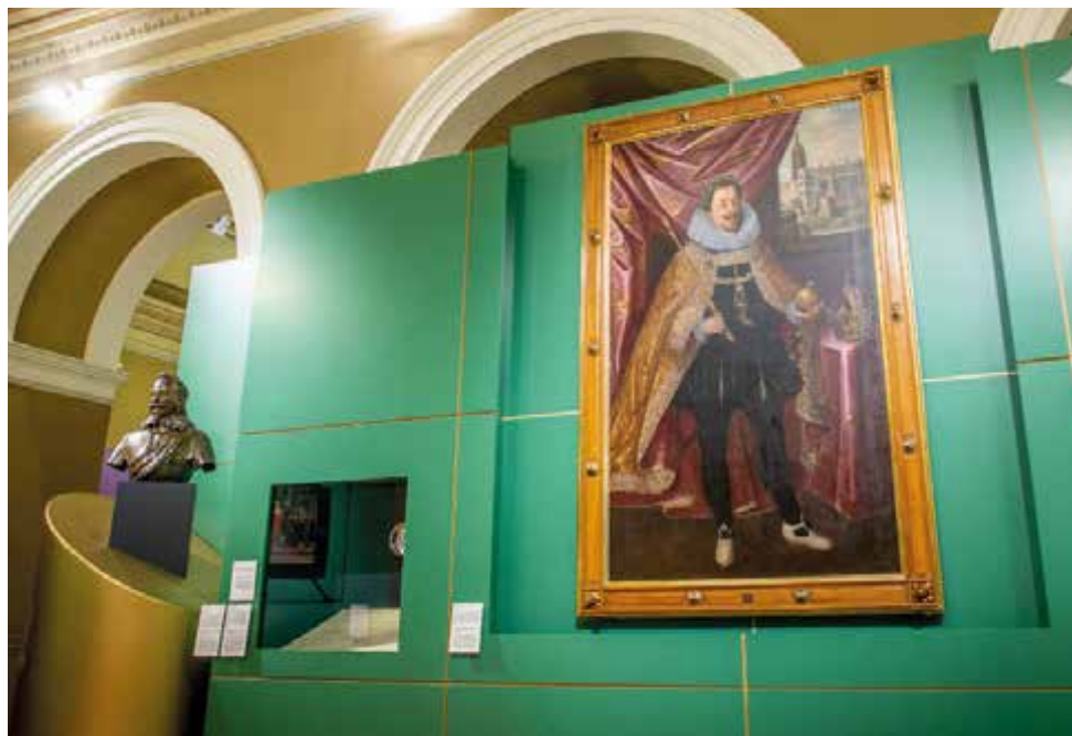
Busta Maxmiliána I. Bavorského a obraz Ferdinanda II.

Vedle našich velkých sbírkových institucí, jako je Národní muzeum, Národní památkový ústav, Národní galerie v Praze, Uměleckoprůmyslové muzeum v Praze, Arcibiskupství pražské nebo Správa Pražského hradu se na výstavě objeví exponáty z vlastnictví menších organizací, měst, far či od soukromých vlastníků. Podobně je tomu i v případě zahraničních zapůj-