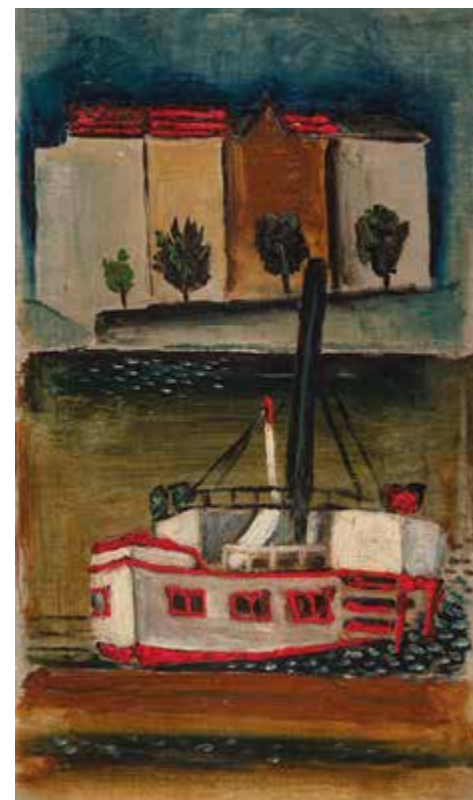
Josef Šima: Z Marseille, 1923. NGP