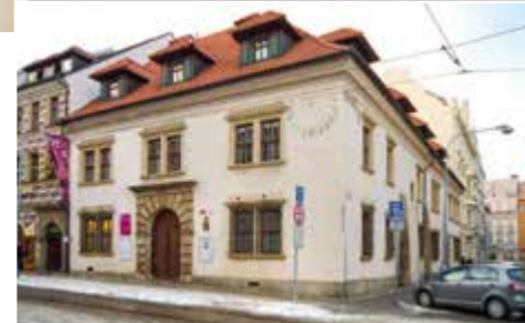
Západočeské galerie v Plzni, výstavní síň, Pražská 13

Existenční zajištění nacházeli někteří umělci v živnosti, která mohla být spjata i s „neuměleckým“ podnikáním. Pracovali se vzorníky, nebránili se kopiím, multiplikaci motivů a děl či užití nových reprodukčních technologií. Úspěšnost prodeje navíc podporovali i produkcí malých, finančně dostupnějších formátů. Kromě oblíbených krajin nebo žánrových scén napl-